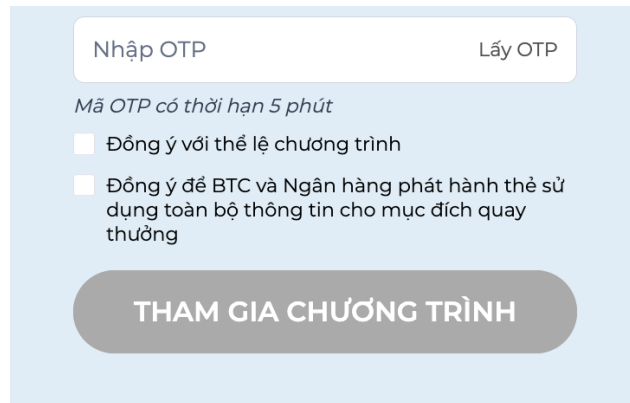
(Hình ảnh minh họa)