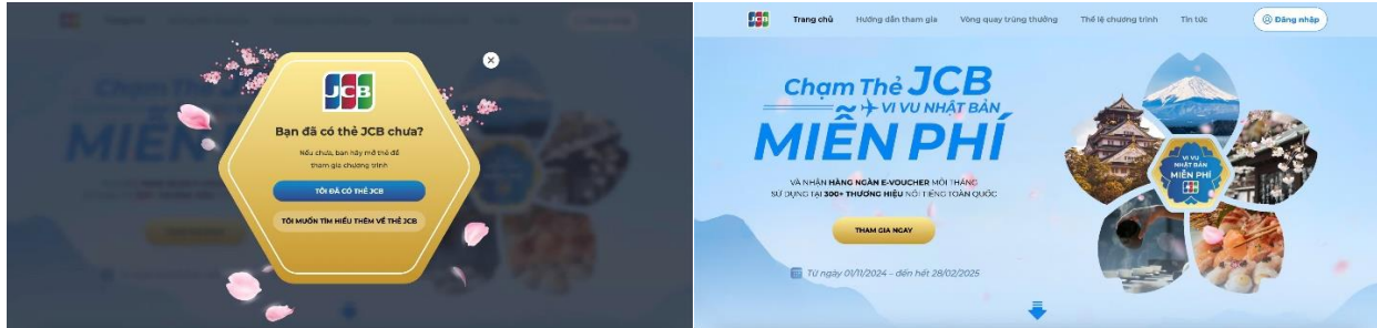
(Hình ảnh minh họa)

Thông tin để đăng ký tài khoản tham gia chương trình bao gồm: